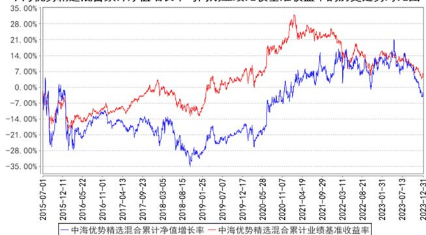
中海优势精选混合累计净值增长率与同期业绩比较基准收益率的历史走势对比图